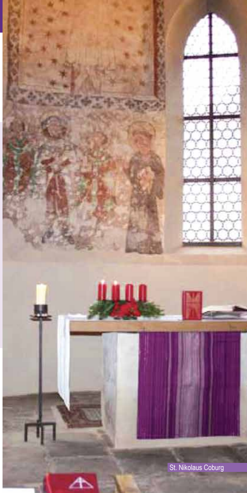
St. Nikolaus Coburg