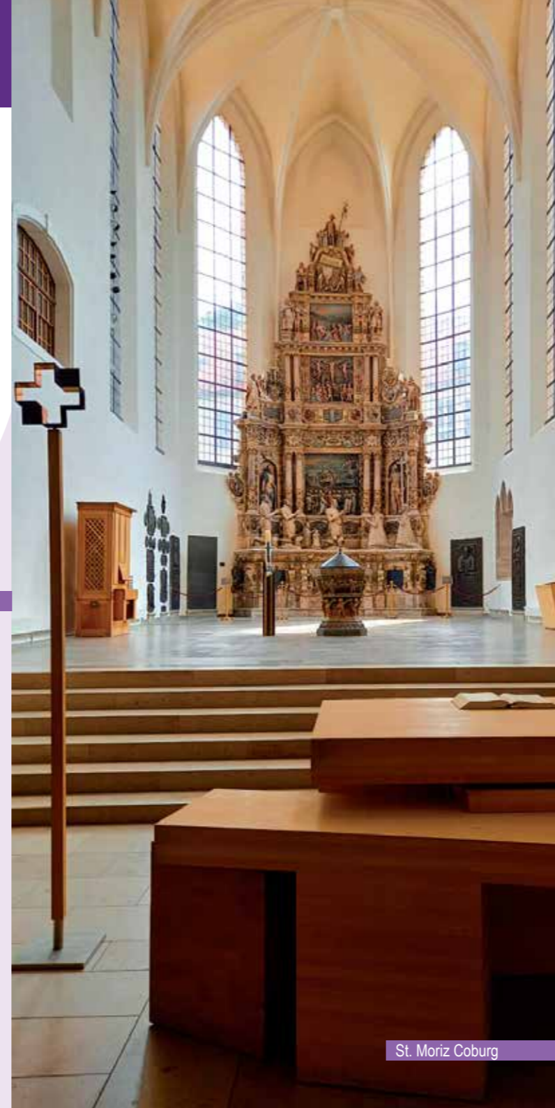
St. Moriz Coburg