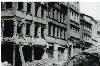
Zerstörte Häuser in Coburg 1945